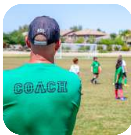
1 POSTO OMAGGIO